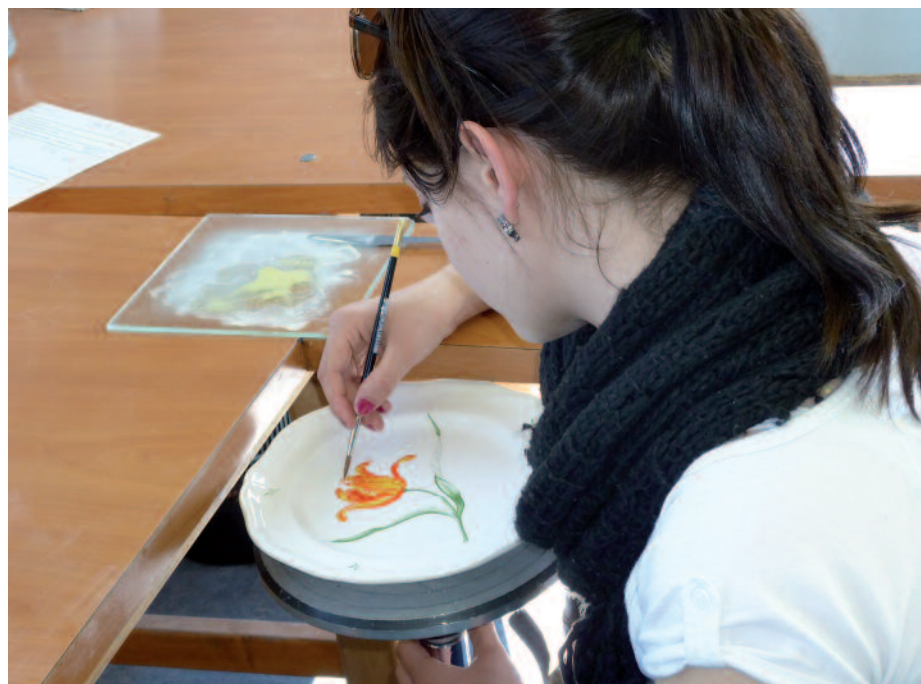
LFO Henri Brisson, Vierzon

Le développement de l'apprentissage occupe les débats médiatiques et presque tou-tes les ministres invité-es à s'exprimer en font la promotion. Présenté comme une solution magique au chômage, à la reprise économique, à l'insertion réussie voire à l'échec scolaire, il bénéficie de largesses financières inédites. Ces aides réclamées haut et fort par les organisations patronales sont généralement reconduites sans bilan rigoureux. Pourtant il existe bien une face cachée peu glorieuse de l'apprentissage.