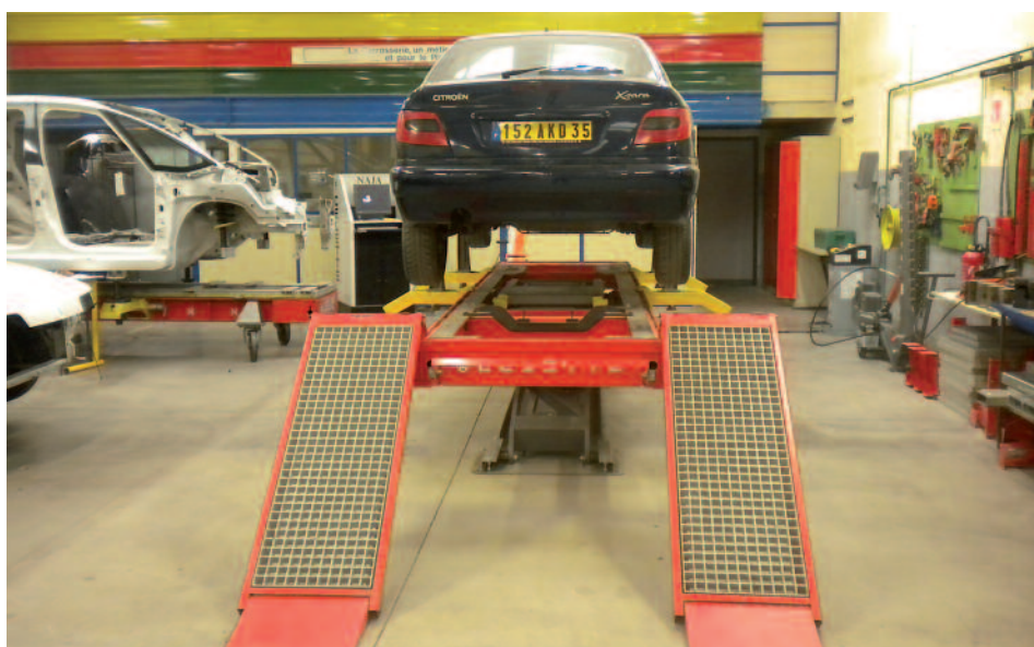
L.P. Bel Air, Timéniac

En perte de dynamisme, la VAE voit son nombre de candidat-es diminuer continuellement. En 2021, ce sont un peu plus de 11 000 diplômes professionnels qui ont été délivrés par les jurys sur 16 540 dossiers examinés ; 26 400 demandes étaient recevables.