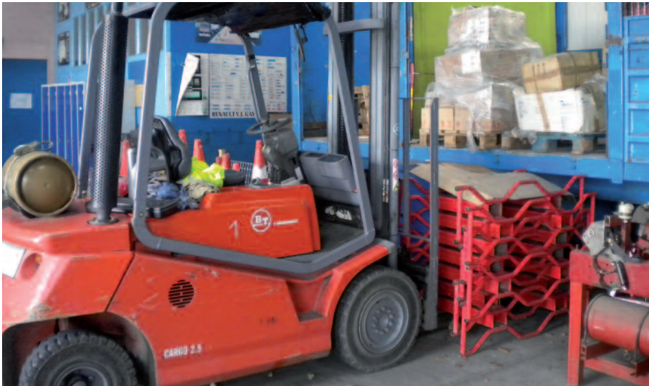
LP Bel Air, Timéniac

Après plus de quatre années d'expérimentation en lycée professionnel, PROFAN délivre ses premiers enseignements dans un rapport d'avril 2022 intitulé « Partager l'expertise : l'interdépendance positive, un levier pour de nouvelles compétences ? »